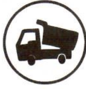
Transportadora de materiales.