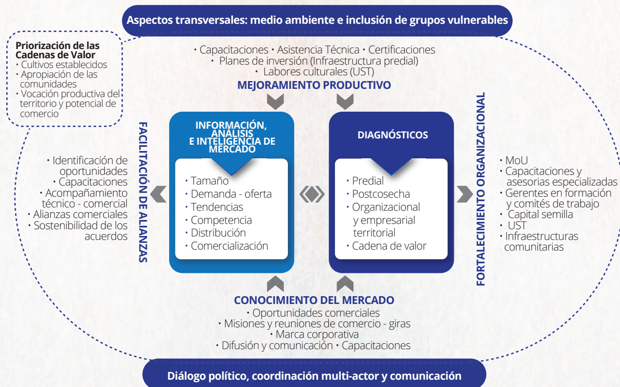
Figura 1 - Modelo de intervención para el fortalecimiento de cadenas de valor estratégicas en contextos afectados por el conflicto

Es importante considerar que todo el modelo está atravesado por aspectos transversales que son clave para cualquier proyecto de desarrollo, como sean el medio ambiente y la inclusión de grupos vulnerables.